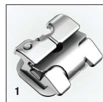
Рисунок 1. Брекет Victory Series™ Active SL

Поэтому, когда мне предложили попробовать брекет-систему Victory Series™ Active SL, я сохранял свой скептицизм относительно активных самолигирующихся брекетов. В конце концов она выглядела также, как и все остальные системы на рынке, которыми я пользовался и на которые я жаловался. Она имела схожий лигирующий механизм. Что же такого особенного могло быть в этой брекет-системе?